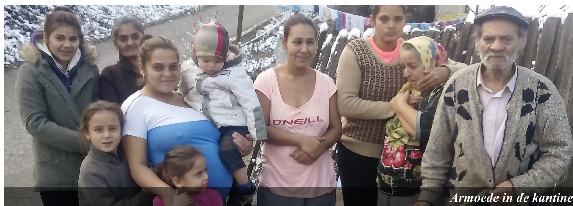
Armoede in de kantine

De eerste maanden van dit jaar zijn – naast de vele mooie dingen die we meemaken – behoorlijk heftig geweest. Het een na het ander gebeurde of kwam naar boven. Bij sommige kinderen op de tienergroep zien we steeds meer rebellie. Op Facebook zien we jonge kinderen die naar de kerk komen op zeer seksistische manier dansen voor de camera. Een vrouw die haar man probeert te vernederen via Whatsapp. Een klant van de kantine die doordraait en ondanks zijn grote armoede geen eten meer van ons aanneemt. Een man die zichzelf ophangt in een wijk waar we regelmatig komen, enz. We zien een enorme strijd die we als leiders te voeren hebben.