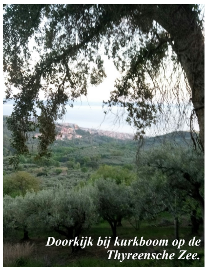
Doorkijk bij kurkboom op de Thyreensche Zee.