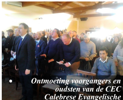
• Ontmoeting voorgangers en oudsten van de CEC Calabrese Evangelische

'Veel Italianen zien onrecht om zich heen en maken zich er boos over. De Bijbel biedt richtlijnen en wijst op God, de rechtvaardige rechter.'