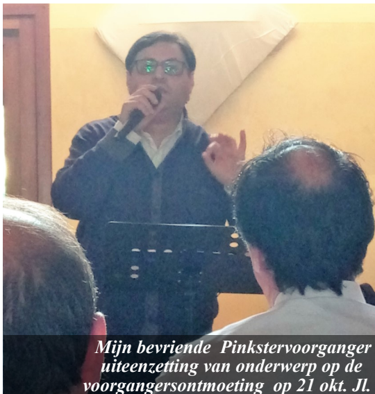
Mijn bevriende Pinkstervoorganger uiteenzetting van onderwerp op de voorgangersontmoeting op 21 okt. Jl.

Begin vorige maand sprak een jonge evangelist en rapzanger uit Turijn hier op een pleintje dicht bij de hoofdstraat van Lamezia Terme. Bijzonder gemotiveerd en geïnspireerd bracht hij door middel van rap zijn getuigenis, met de oproep Jezus in je leven toe te laten; woorden die spreken van persoonlijke ervaringen.