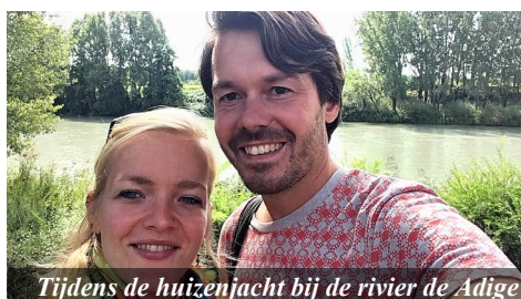
Tijdens de huisenjacht bij de rivier de Adige

Dank en bid voor overgave en vertrouwen bij elke stap die we zetten. Bid voor rust, energie en goede verdeling van prioriteiten tijdens dit grote proces van het loslaten van Breda en het voorbereiden op onze emigratie naar Italië. Bid voor onze taalstudie en onze lerares die nu soms op de brunch komt. We verlangen ernaar dat hier op aarde Gods wil wordt gedaan, net zoals Zijn wil in de hemel wordt gedaan.