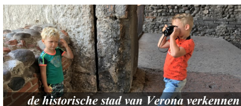
de historische stad van Verona verkennen