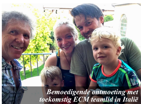
Bemoedigende ontmoeting met toekomstig ECM teamlid in Italië