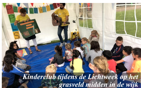
Kinderclub tijdens de Lichtweek op het grasveld midden in de wijk

De huizen in de binnenstad zijn net als in Nederlandse steden enorm duur, maar ver van de stad wonen leek ons ook niet erg handig in verband met het contact met Italianen. Dat is juist het doel van deze roeping! Verder willen we in Italië, zoals we dat in Nederland ook altijd hebben gedaan, voor een gedeelte in ons eigen levensonderhoud blijven voorzien. In Italië is dit goed mogelijk door verhuur van een vakantie-appartement. Door het verhuren van een vakantie appartement kunnen we zelf in een gedeelte van de inkomsten voorzien. Dit kost in verhouding weinig tijd. Die tijd kunnen we dus inzetten voor de missie. Wanneer je een betaalbaar huis wil, kom je uit bij een huis dat opgeknapt moet worden. Hier zijn we in Breda gelukkig ook al aan gewend. We hopen de eerste 1 à 2 jaar klussen te combineren met taal- en cultuurstudie.